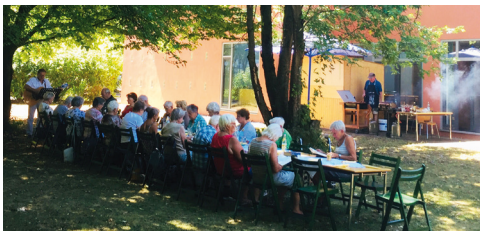
Erinnern Sie sich? Die SeniorInnen wussten auch 2022 zu feiern!

Die SeniorInnen unserer Gemeinde treffen sich am 6. August 2025 ab 12.30 Uhr zu ihrem Treffen zum Sommer mit herzhaftem Grillgut sowie später Kaffee und Kuchen. Herzliche Einladung!