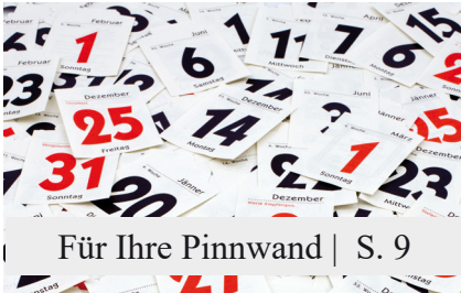
Für Ihre Pinnwand | S. 9