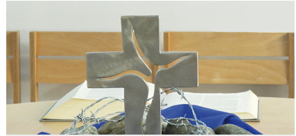
Gottesdienste | S. 10f