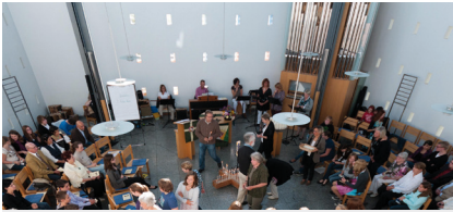
Herzliche Einladung | S. 8