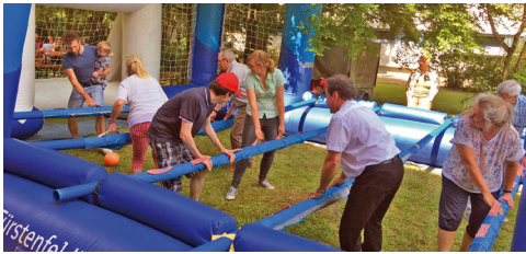
Erinnern Sie sich? Viel Spaß beim Sommerfest 2018

Wir laden Sie alle herzlich ein zu unserem Sommerfest am Sonntag, den 13. Juli 2025 . Nach dem Gottesdienst starten wir um 11 Uhr im Kirchgarten der Magdalenenkirche mit gemütlichem Beisammensein, der einen oder anderen Überraschung und natürlich ist für das leibliche Wohl gesorgt.