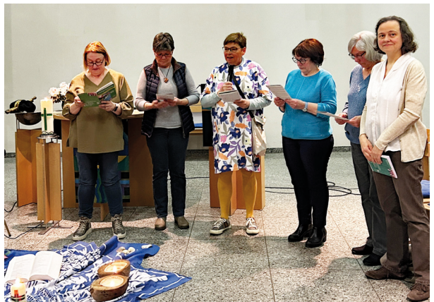
Weltgebetstag 2025: Die Lektorinnen

Auf Wiedersehen Kia orana S. Tschuk/B. Hoos