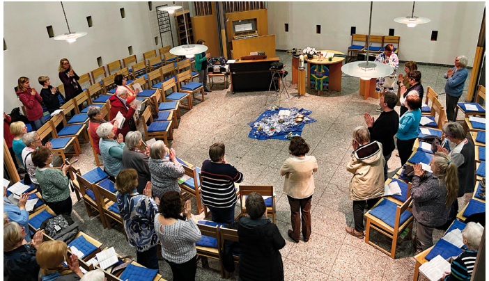
Weltgebetstag 2025 in der Magdalenenkirche

An dieser Stelle möchten wir uns bei allen Helferinnen bedanken. Auch vielen Dank für die mitgebrachten Speisen. Die Spenden für die Projekte zum Weltgebetstag beliefen sich auf € 334,80. Wir freuen uns sehr darüber und bedanken uns ganz herzlich.