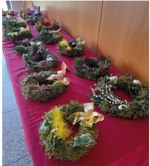
Osterbasar 2025: Ein breites Angebot an Türkränzen und anderen Bastelarbeiten für den Ostertisch.