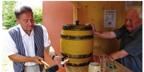
Beim Grillen darf auch das nicht fehlen! (2023)

Auch die lieb gewordene Tradition des Grillen für Daheimgebliebene wollen wir dieses Jahr nicht missen Am 7. August 2025 ab 18 Uhr sind Sie alle herzlich willkommen zu einem (hoffentlich) schönen und warmen Sommerabend, um sich näher kennen zu lernen, alte Bekanntschaften zu erneuern und die Kinder dürfen selbstverständlich auch im Kirchgarten toben!