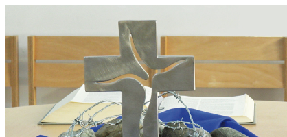
Gottesdienste | S. 10f