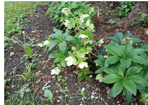
Das Frühlingsbeet im Mai 2026