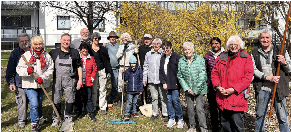
Ein Dank an die vielen fleißigen HelferInnen!

heimischer Kräuter stattgefunden. Damit haben wir die von uns beantragten und von der Landeskirche genehmigten Maßnahmen zur naturnahen Renovierung des Kirchgartens vollständig umgesetzt. Nun können wir den geforderten Ab-