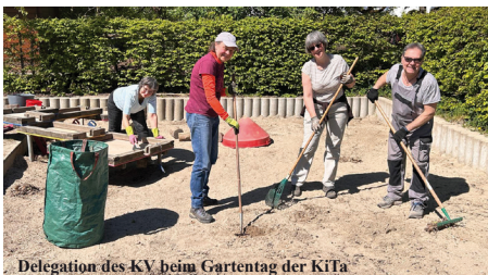
Delegation des KV beim Gartentag der KiTa