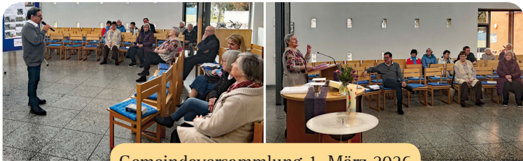
Gemeindeversammlung 1. März 2026