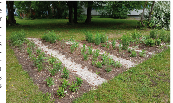
Unser neues Blümelbeet im Mai 2026

ronenkuchen. Mineralwasser, Limonade, Kaffee und Tee rundeten die Mahlzeit ab. Gut gestärkt konnten die Arbeiten bis in den Nachmittag hinein fortgesetzt werden.