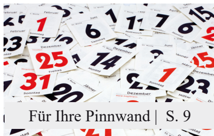
Für Ihre Pinnwand | S. 9