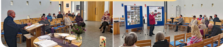
Dekanatssynode 21. März 2026